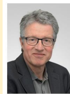
シュタイナー先生

★蹄管理セミナー (酪農学園大学) 8/19 シュタイナー教授 : スイスの蹄病コントロールから 酪農大学外科スタッフ : 蹄に関する最近の研究から ゾエティス社 : ゲノムと跛行